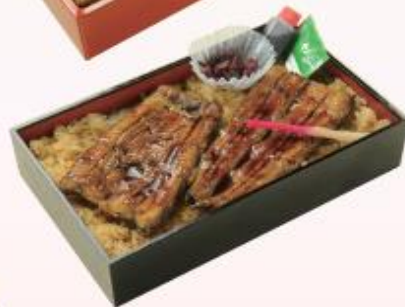
国産 鰻一本入り 特うなぎ重 3,240円(税込)

特上のう巻と最高級の国産うなぎが絶妙の味のハーモニーを奏でます。花ごよみ自慢の逸品です。