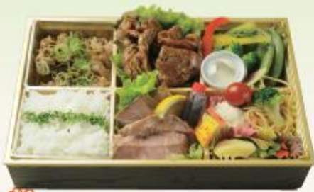
特選肉三昧弁当 2,160円(税込)

和牛焼肉、牛タン、若鶏照焼、豚しゃぶと、バラエティに富んだお肉を楽しめるお弁当。温野菜のパーニャカウダを添えています。