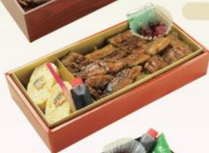
国産 うなぎ巻付 うなぎ弁当 2,700円(税込)

最高級の国内産うなぎを使用しています。江戸風に蒸して焼き、ふっくら柔らかい仕上がりの花ごよみ名物料理をご堪能ください。