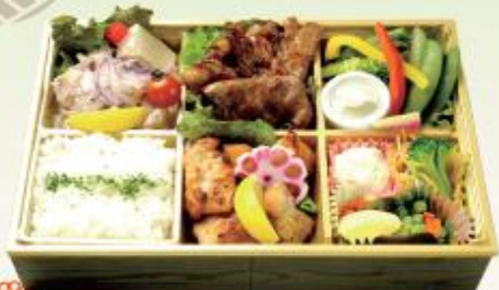
特選桔梗(ききょう)弁当 2,160円(税込)