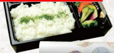
特選肉弁当 1,944円(税込) W210mm×D210mm×H50mm

和牛の焼肉と牛タンに、豚しゃぶと肉三昧のお弁当。それぞれの滋味を存分にお楽しみください。お茶ペットボトル500ml付