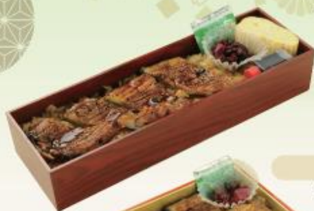
国産 うなぎ弁当 2,160円(税込)