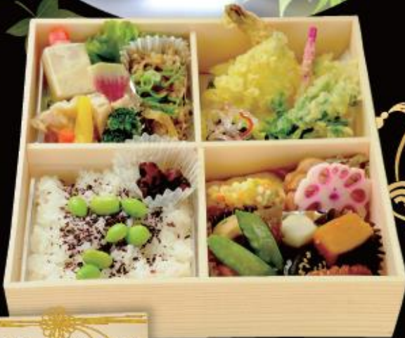
花ごよみ弁当 1,620円(税込) W220mm×D220mm×H60mm

老舗料理屋の屋号を冠したお弁当には、まさに店を代表する料理が勢揃い。牛すき煮、若鶏蒸し煮、天ぷら、そして季節の炊合せと、名代の味の詰め合わせです。 お茶ペットボトル500ml付